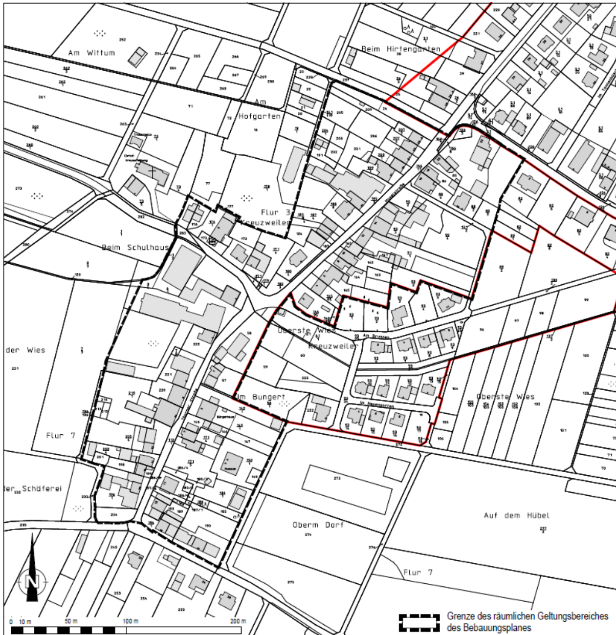
Abbildung 1: An den Geltungsbereich (schwarze unterbrochene Linie) angrenzende bereits rechtskräftige Bebauungspläne (rot) für den Altort Kreuzweiler.

Der Bebauungsplan wird als einfacher Bebauungspläne gemäß § 30 Abs. 3 BauGB nach den Vorschriften § 13 BauGB im vereinfachten Verfahren aufgestellt. Gemäß § 13 Abs. 1 Satz 1 BauGB ist das vereinfachte Verfahren zulässig, da es sich bei dem Geltungsbereich um unbeplanten Innenbereich handelt, für den die Vorschriften des § 34 BauGB Anwendung finden und in denen der sich nach § 34 BauGB aus der jeweiligen Umgebung ergebende Zulässigkeitsmaßstab nicht wesentlich verändert wird: